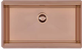
RIVA 750 COPPER SOUS PLAN N034 S58