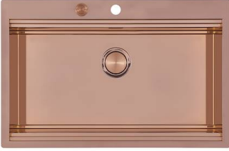
RIVA 750 COPPER N034 F58